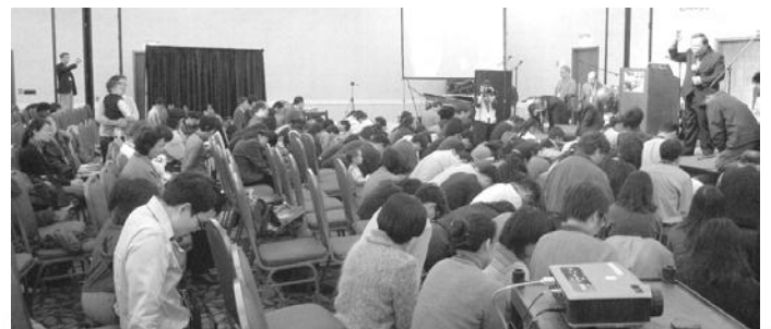
賴木森牧師為回應呼召的信徒禱告