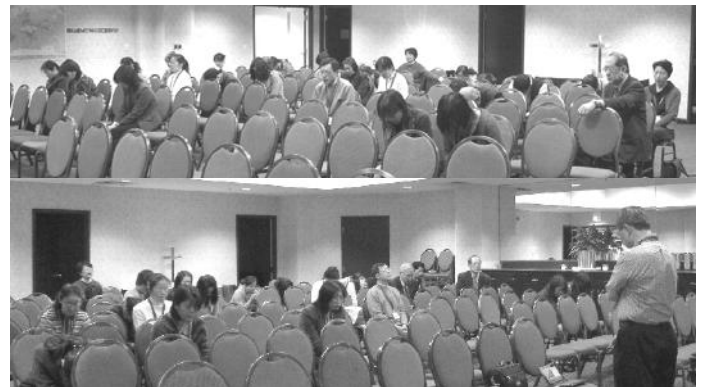
在大會禱告室裡，為大會守望禱告的勇士

大會後，我們不敢停止禱告。我們會繼續邀請代禱伙伴，你若接到我們的邀請，請你欣然答應好嗎？